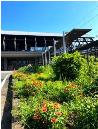
もろもろ繁茂「みんなの庭」