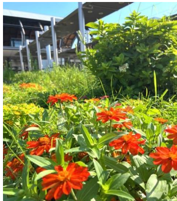
元気な百日草(ジニア)