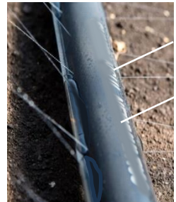
敷設した灌水チューブ

— 北口ロータリーの北端に私どもの手で植えてあった（平成30年）ヒメシャラが枯れてしまいました。秋を待っての植え替えを考えています（別添の植樹状況図Fをご参照。管理者高知市みどり課に報告済み）。