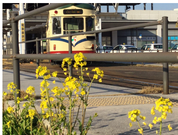
電車と一緒に絵になりますね