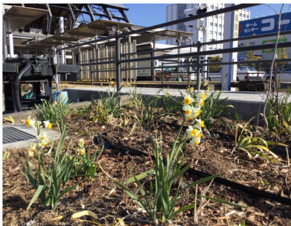
季節の花スイセン。毎年顔を出してくれます。