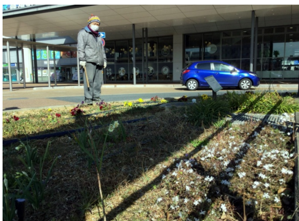
これはシバザクラ。本来は4～5月に花を咲かせるそうですが、南国高知で早咲きです。